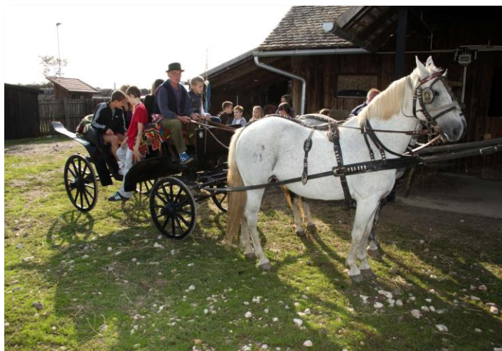
Tradicionalna vožnja fijakerom na slavonskom salašu