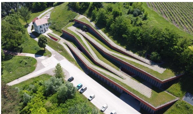
Muzej vučedolske kulture

Datum izrade: 27.01.2023. Ponudu izradio: Dino Duspara